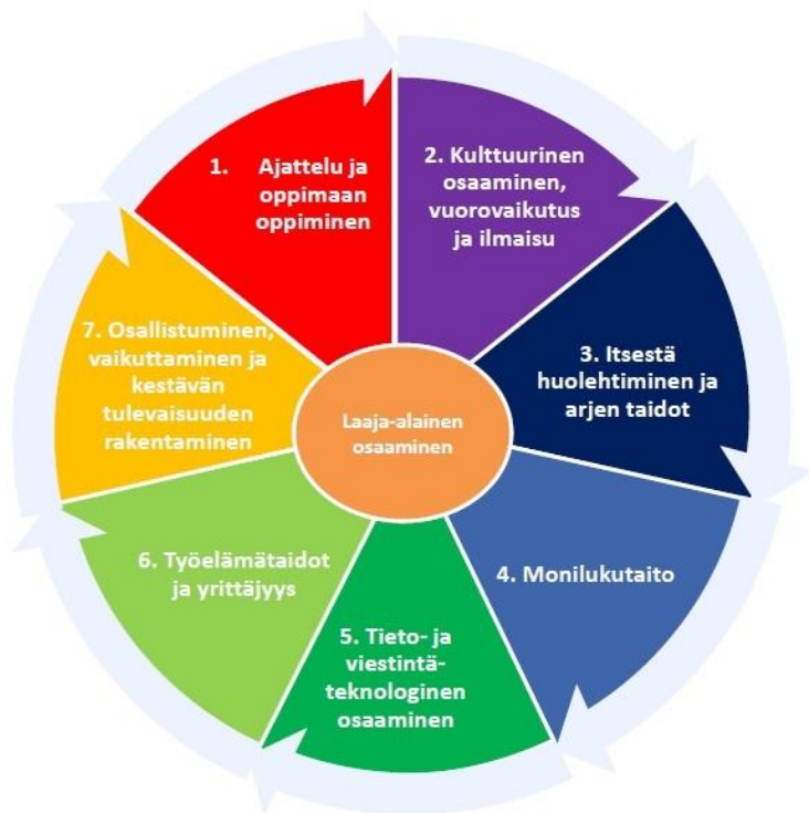
Kuva 2 Opetushallitus, POPS2014, laaja-alainen osaaminen

Tällä sivulla kuvataan, mitkä laaja-alaisen osaamisen tavoitenäkökulmat painottuvat vuosiluokilla 3 – 6. Opetussuunnitelmassa on määritelty laaja-alaisen osaamisen yleistavoitteet luvussa 3, Perusopetuksen tehtävä ja tavoitteet. Laaja-alaisen osaamisen kehittämistä jatketaan systemaattisesti. Tavoitteena on, että oppilaan osaamisen kehittyminen vahvistaa edellytyksiä itsensä tuntemiseen ja arvostamiseen sekä oman identiteetin muotoutumiseen. Identiteetti rakentuu vuorovaikutuksessa toisten ihmisten ja ympäristön kanssa. Ystävyyden ja hyväksytyksi tulemisen merkitys on suuri. Ikävuodet ovat erityisen otollisia myös kestävän elämäntavan omaksumiselle ja kestävän kehityksen tarpeen pohtimiselle.